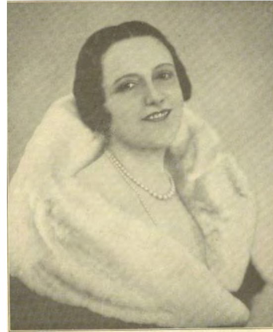
Wiener Salonblatt, 4. Jänner 1931