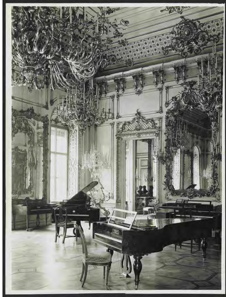
Sammlung alter Musikinstrumente, Palais Pallavicini, Ausstellung "Klaviere aus fünf Jahrhunderten", 1939