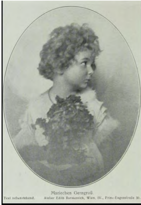
Wiener Salonblatt, 29. April 1922