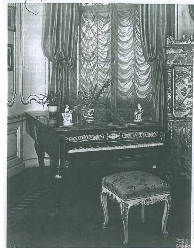
Illustration of the piano from the act SAM 35/39-40