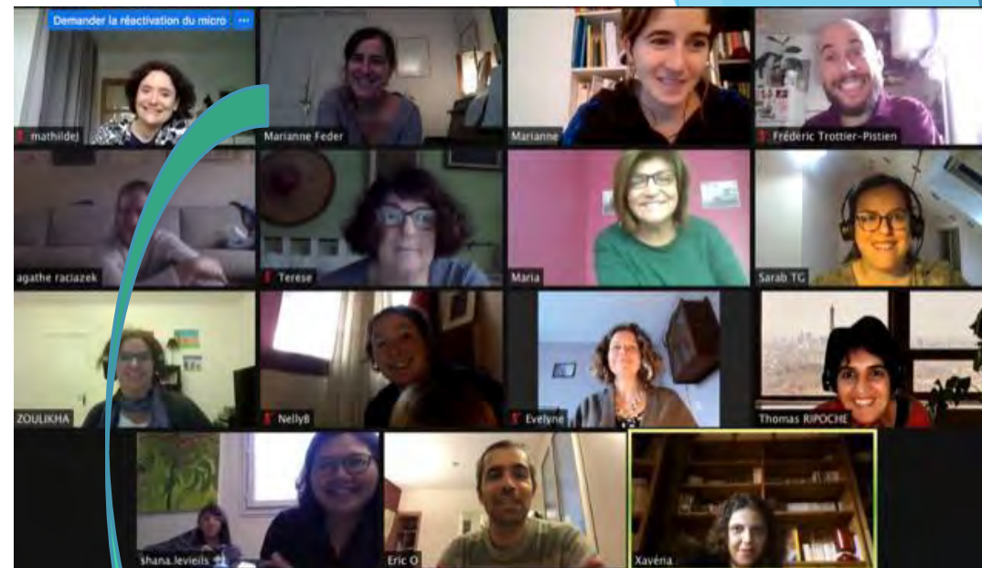
Capture d'écran visioconférence de Chantons Ensemble (Octobre 2021)