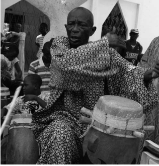
Doudou Ndiaye Rose

On ne présente plus Doudou Ndiaye Rose, percussionniste de renommée internationale, ce griot qui a marqué son époque et l'histoire culturelle du Sénégal. Dans le monde entier, il est le représentant du tambour sabar , emblème de la tradition musicale wolof. Initié très jeune au tambour sabar , consacré par Léopold Sédar Senghor « meilleur batteur du Sénégal », il a collaboré avec de nombreux artistes comme Maurice Béjart, Miles Davis, les Rolling Stones, avant d'être qualifié de « trésor humain vivant » par l'Unesco, en 2000. Son approche de la percussion est innovante. Il a inventé de nouveaux rythmes, aisément accessibles, destinés à un public passionné mais néophyte, ce qui lui a permis d'établir sa réputation mondiale.