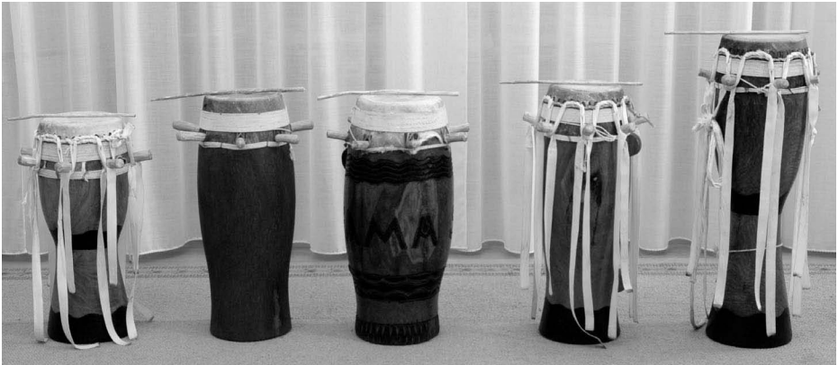
Ensemble sabar . De gauche à droite : mbëñ mbëñ , goron talmbat , làmb , goron mbabas et ndeer

Sabar désigne un ensemble de tambours de forme conique spécifique à la population wolof du Sénégal. Au sein de cet ensemble, chaque tambour a sa propre fonction : le ndeer et le goron mbabas ont un rôle de soliste tandis que le mbëñ mbëñ , le làmb et le goron talmbat assurent l'accompagnement. La hauteur des sons varie selon la taille et la forme de l'instrument ; certains tambours sont à moitié pleins et fermés à la base.