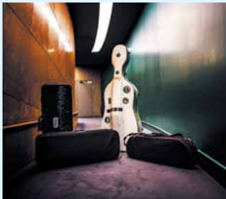
Quatuor à cordes. Coulisses. Salle des concerts.