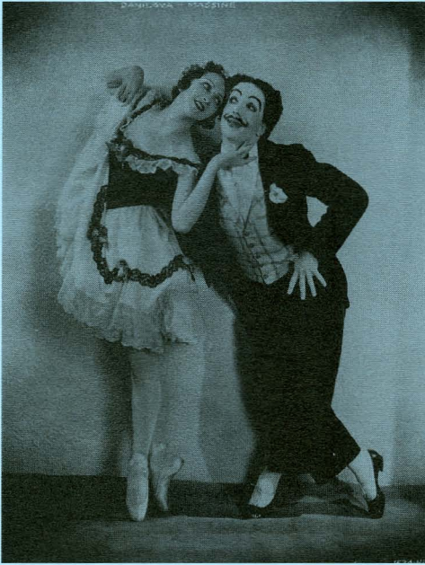
La Boutique fantasque, Alexandra Danilova et Léonide Massine en danseurs de cancan