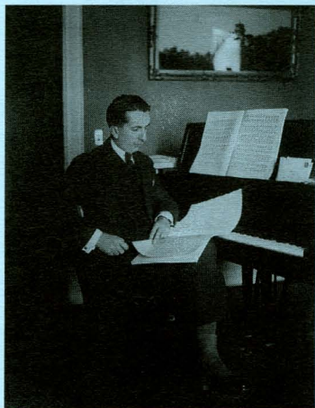
Alfredo Casella

Alfredo Casella arrive à Paris à l'âge de 13 ans pour suivre des études de musique au Conservatoire, où il rencontre le jeune Maurice Ravel. Il devient compositeur, pianiste et chef d'orchestre !