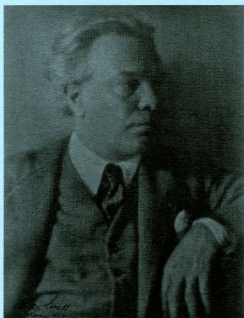
Ottorino Respighi, photographie de Ghitta Lorell, Rome, 1934 © Gallica BnF

Respighi a choisi de faire honneur à un autre compositeur de son pays, Giacchino Rossini, en transcrivant pour orchestre ses Péchés de vieillesse . Ainsi naît La Boutique fantasque , ballet créé en 1919 par la troupe de danseurs de Serge Diaghilev, les Ballets russes. La musique suit pas à pas l'histoire d'un fabricant de jouets et de ses poupées. Après une ouverture musicale brillante, les poupées séduisent les passants par une tarentelle . Puis, sur une musique humoristique, un couple de danseurs de cancan impressionne le public : un Américain décide alors d'acheter le danseur, tandis qu'un Russe choisit la danseuse. Le fabricant conclut la vente et propose aux familles de récupérer les poupées le lendemain. Mais celles-ci prennent vie durant la nuit : un nocturne débutant par un accompagnement de harpe fait place à la rêverie. Le couple s'échappe pour rester uni. Le lendemain, les clients menacent le fabricant, sauvé par ses poupées qui chassent Américains et Russes de la boutique dans un galop final effréné.